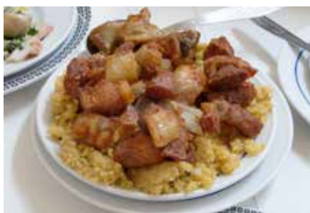
MIGAS COM CARNE DE PORCO PRETO