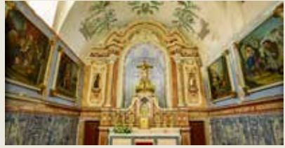
IGREJA DAS CHAGAS DO SALVADOR Castro Verde