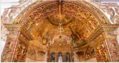
ERMIDA DA N. SR.ª. DA ESPERANÇA Entradas