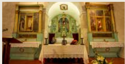
IGREJA DE S. MARCOS DA ATABOEIRA São Marcos da Ataboeira