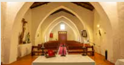
IGREJA MATRIZ DE SANTA BÁRBARA Santa Bárbara de Padrões