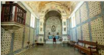
ERMIDA DE SÃO MIGUEL Casével