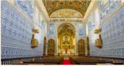
BASÍLICA REAL Castro Verde