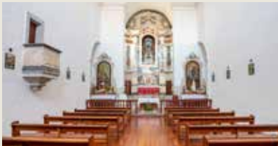
IGREJA MATRIZ DE ENTRADAS Entradas