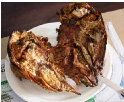
CABEÇA DE BORREGO ASSADA

Nos restaurantes da região podem saborear-se pratos tradicionais como as sopas de peixe, as açordas, as migas com carne de porco preto, as sopas de tomate, cação ou beldroegas, o gaspacho, o ensopado de borrego, os pratos de caça e a doçaria regional.