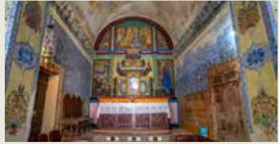
IGREJA DA MISERICÓRDIA Entradas