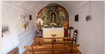
ERMIDA DE ARACELIS Salto - São Marcos da Ataboeira