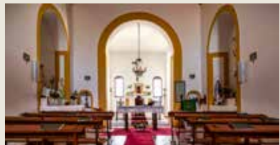
IGREJA MATRIZ DE CASÉVEL Casével